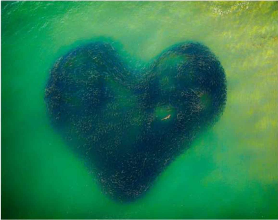
Love Heart of Nature

" Amor corazón de la naturaleza" del fotógrafo australiano Jim Picôt es el ganador absoluto de la edición 2020 de los Drone Photo Awards , el principal concurso internacional de fotografía aérea. En invierno, un tiburón está dentro de un banco de salmones cuando, persiguiendo al pez carnada, la forma se convirtió en forma de corazón.